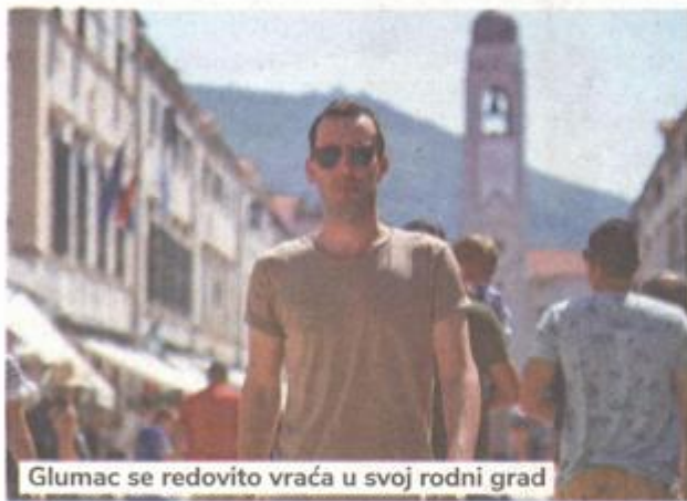
Glumac se redovito vraća u svoj rodni grad