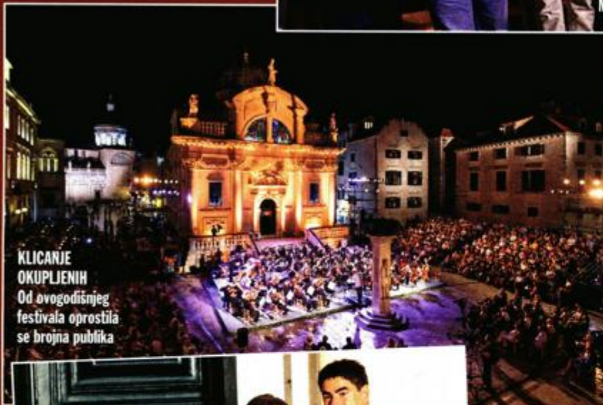
KLICANJE OKUPLJENIH Od ovogodišnjeg festivala oprostila se brojna publika