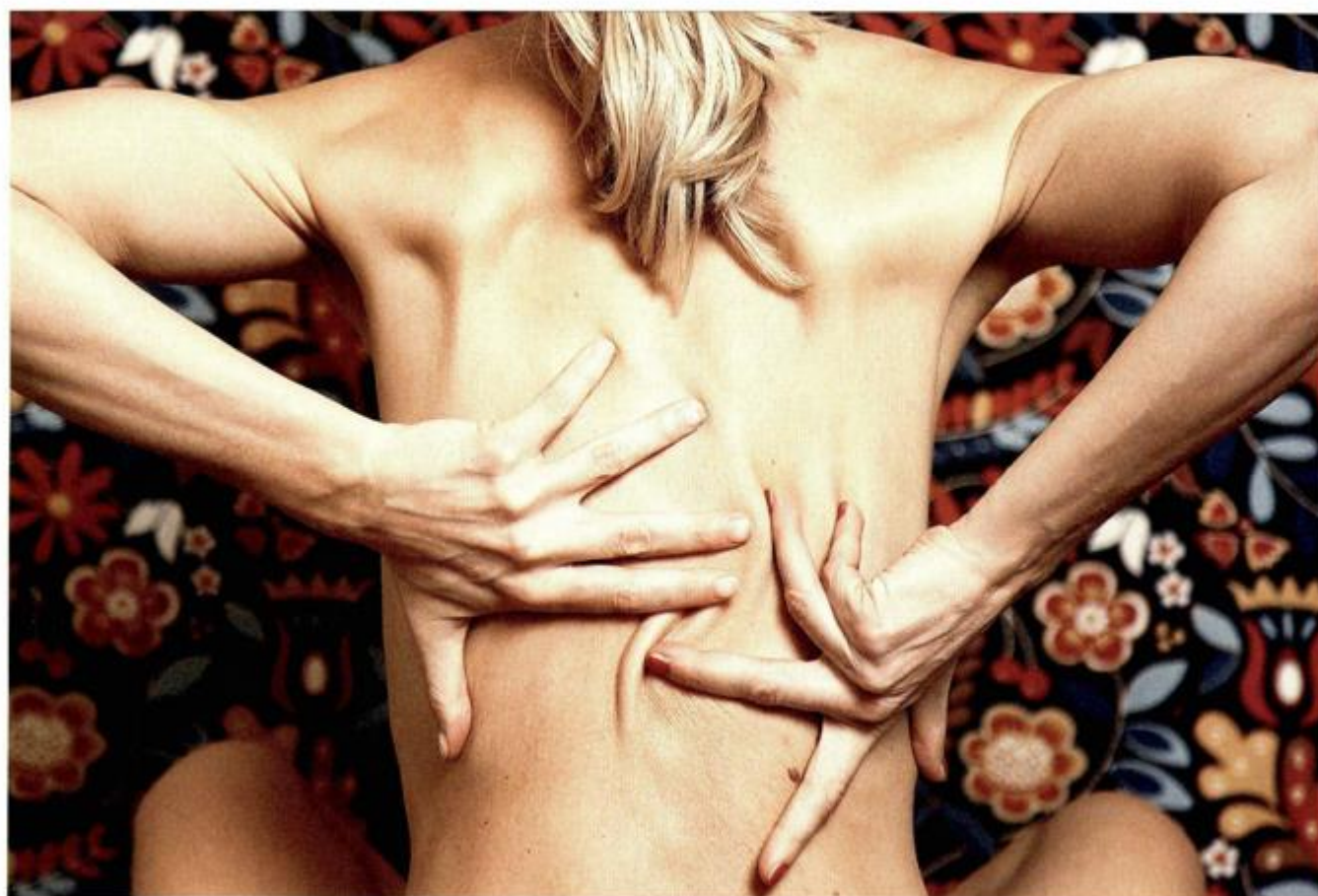
Mara Bratoš je 2015. snimila hrabru seriju autoaktova - bez Photoshopa i ikakvog uljepšavanja - koje je

Evidencijski broj / Article ID: 21079501 Vrsta novine / Frequency: Povremena Zemlja porijekla / Country of origin: Hrvatska Rubrika / Section: