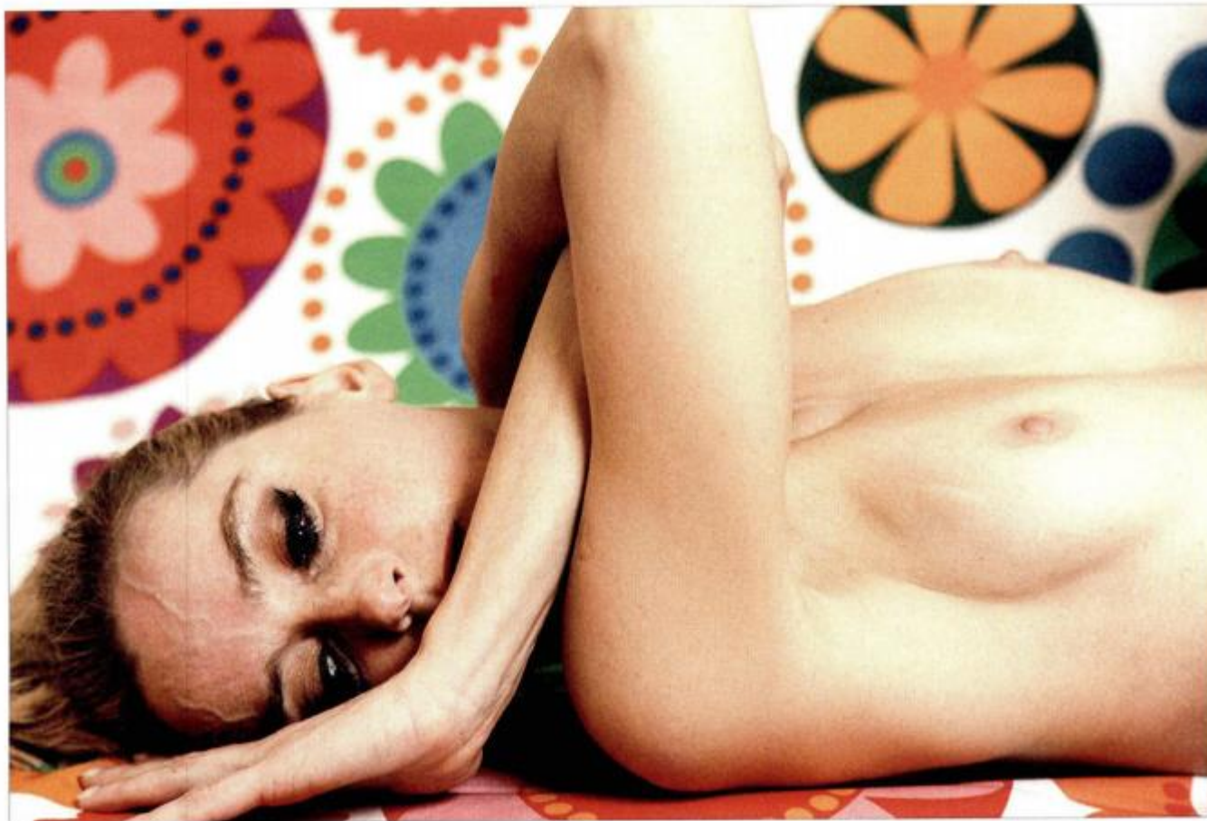
nekoliko godina kasnije izložila u zagrebačkoj Galeriji Kranjčar i Umjetničkoj galeriji Dubrovnik

Evidencijski broj / Article ID: 21079501 Vrsta novine / Frequency: Povremena Zemlja porijekla / Country of origin: Hrvatska Rubrika / Section: