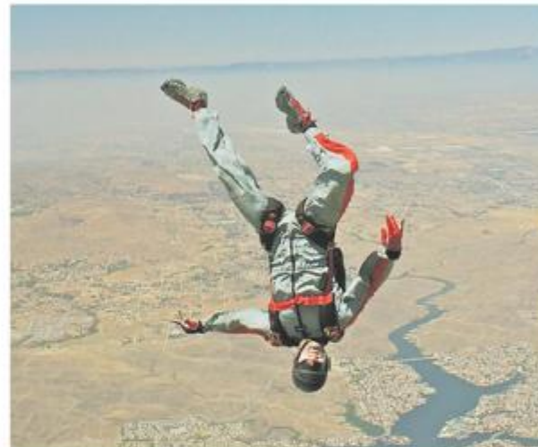
U biografiji ima upisano 600 skokova padobranom