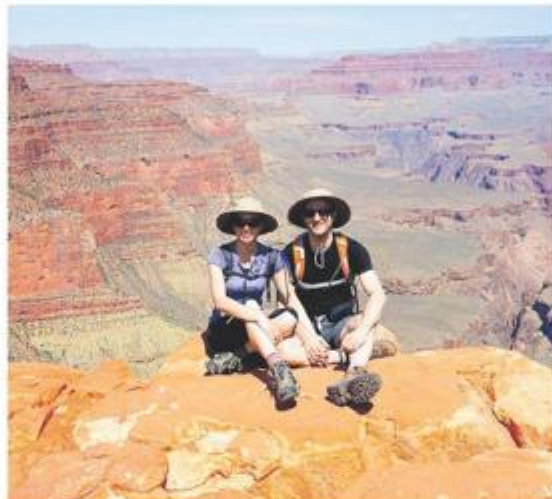
Sa suprugom u Grand Canyonu koji obožavaju