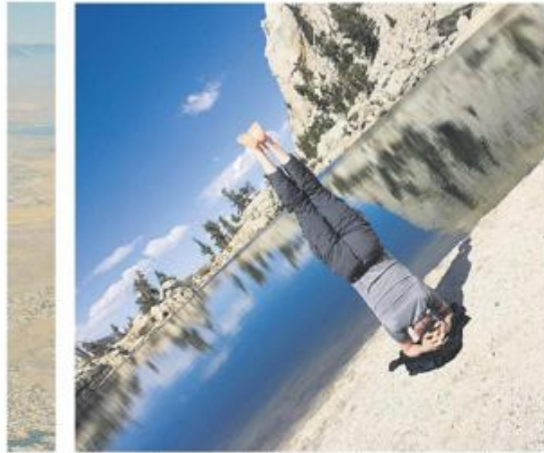
Joga mu je sastavni dio dana, daje mu ravnotežu