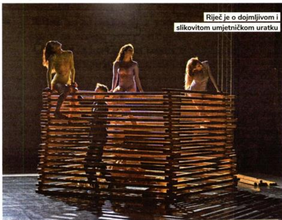
Riječ je o dojmljivom i slikovitom umjetničkom uratku