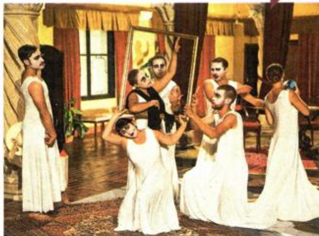
Plesni prizor iz predstave