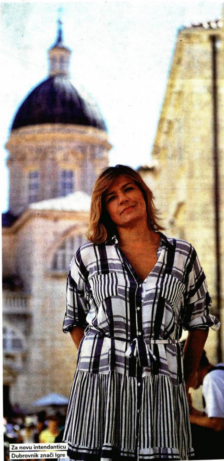
Za novu intendanticu Dubrovnik znači Igre

U trenutku kad se sučeljavamo s odljevom mozгова i ja se osjećam odgovornom reći i ponuditi nešto te u tom smislu ostaviti traga upravo za mladi naraštaj