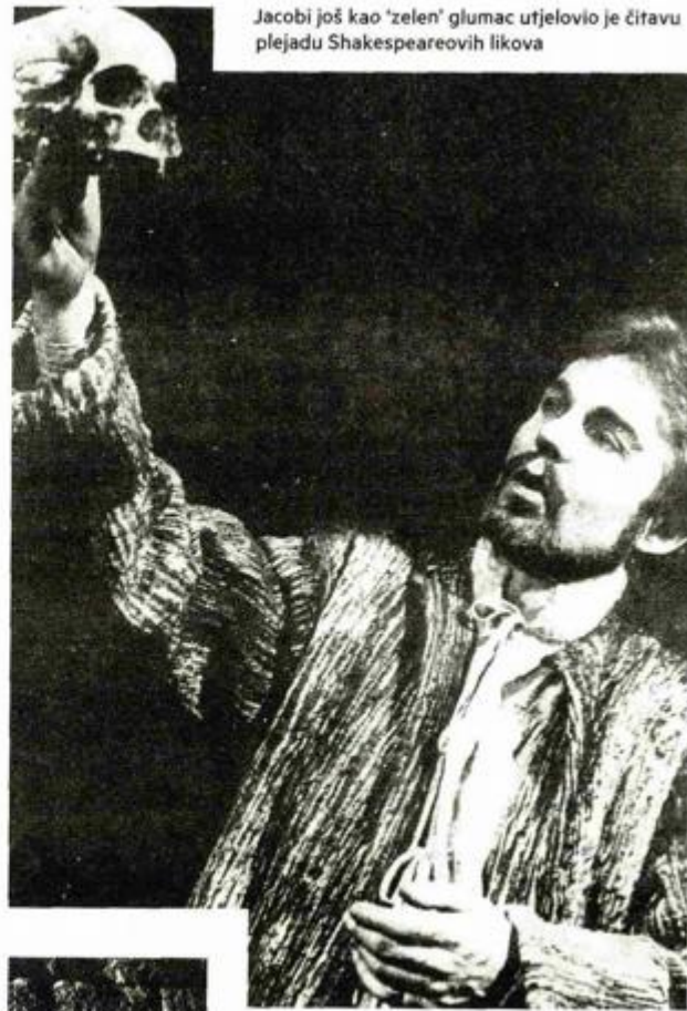
Jacobi još kao 'zelen' glumac utjelovio je čitavu plejadu Shakespeareovih likova

psihosomatski simptomi uzrokovani nervozom. Na njegovim plećima, objasnio je, ležala je prevelika odgovornost. Imao je tad, naime, tek 28-godina, a već ga je kao 'dičnog predstavnika svoje vrste' zapala životna uloga. Izvanrednih glumačkih sposobnosti i oku ugodan, njegove predstave rasprodane su od prvog dana. U međuvremenu koketira s filmskom umjetnošću. Snimivši osamdesetak naslova, u hollywoodske vode, međutim, zaplivat će tek 1988. 'Haninim ratom'. Glavnu ulogu zaigrat će u za Oscar nominiranom 'Prije kiše'. Uslijedit će blockbusteri 'Moćni Joe Young', 'Očim širom zatvorene', 'Nemoguća misija II', 'Svemirski kauboji', 'Zdrpi i briši', 'Batman: Početak', 'Harry Potter i Darovi smrti', 'X-man: Prva generacija', FOX-ova dramska tv-serija '24 sata', PBS-ova uspješnica 'Downton Abby' i dr.