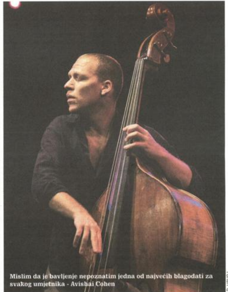
Mislim da je bavljenje nepoznatim jedna od najvećih blagodati za svakog umjetnika - Avishai Cohen

biti ono što jesam«, rekao je. »Za mene ništa što sam učinio u životu, otkako sam počeo stvarati glazbu, nije bilo radikalno. Ništa! Riječ radikalno ne postoji u mom rječniku. Za mene je sve tako povezano, puno više povezano nego što to većina ljudi može razumjeti, ali zato sam ja - ja. Mnogi su zbunjeni, jer u trenutku kad počnu razumijevati ono što čuju, već im nudim nešto drugo. Ne radim to s predumišljajem. To je samo način na koji živim svoj život. Sve se događa sa zakašnjenjem - razumijevanje i praćenje. Ja zapravo ne odabirem koju ću glazbu pisati. Skladbe odabiru mene jednako onoliko koliko ja odabirem njih. Kao da same dolaze. Ja ne odlučujem što ću napisati. Samo slijedim nešto što dolazi k meni i potom to njegujem. S vremenom mi postane jasno što želim podijeliti s drugima. Moje skladbe predstavljaju istinitost trenutka mog života u ovom trenutku.« No bez obzira izvodi li vlastite skladbe, jazz standarde glazbenika koje cijeni: Dukea Ellingtona, Thada Jonesa i Theloniousa Monka, ili pak djela autora drugih žanrova, primjerice Leonarda Cohena ili Beatlesa, njegove su izvedbe uvijek jedinstvene i prepoznatljive.