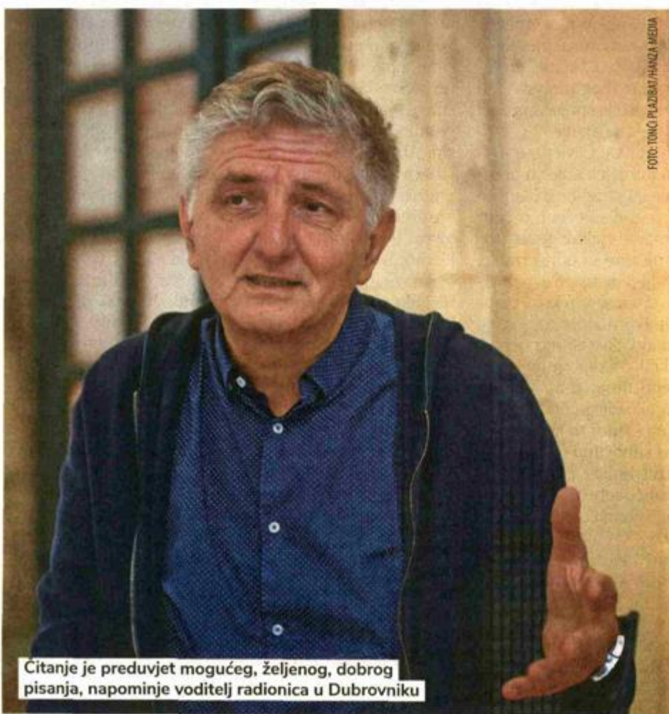
Čitanje je preduvjet mogućeg, željenog, dobrog pisanja, napominje voditelj radionica u Dubrovniku

Naravno da u pripremi imaš različite metode i metodičke postupke. Naravno da sve opremaš različitim tekstovima, ali ono važno u vodenju radionice jest da