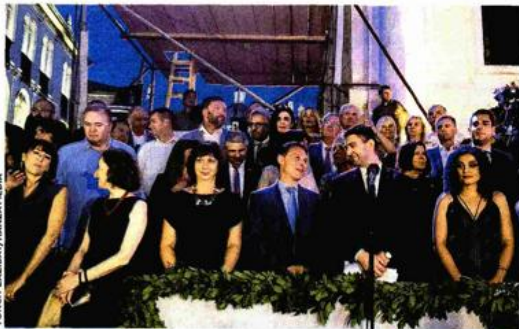
Svečanom otvaranju prisustvovali su i ministrica kulture Nina Obuljen Koržinek te predsjednik Hrvatskoga sabora Gordan Jandroković

upravljanju vlastitom sredinom. Vjerujem kako bi takav pristup i model upravljanja diljem Hrvatske u konačnici preokrenuo negativne trendove i pomogao da se Republika Hrvatska razvije onako kako svi želimo i očekujemo. U tom pogledu i umjetnost je ne-