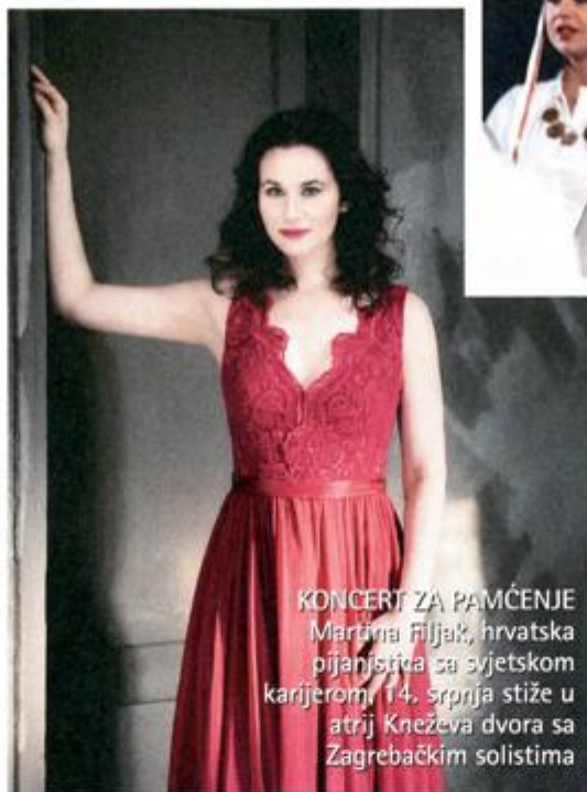
KONCERT ZA PAMĆENJE Martina Filjak, hrvatska pijanistica sa svjetskom karijerom, 14. srpnja stiže u atrij Kneževa dvora sa Zagrebačkim solistima