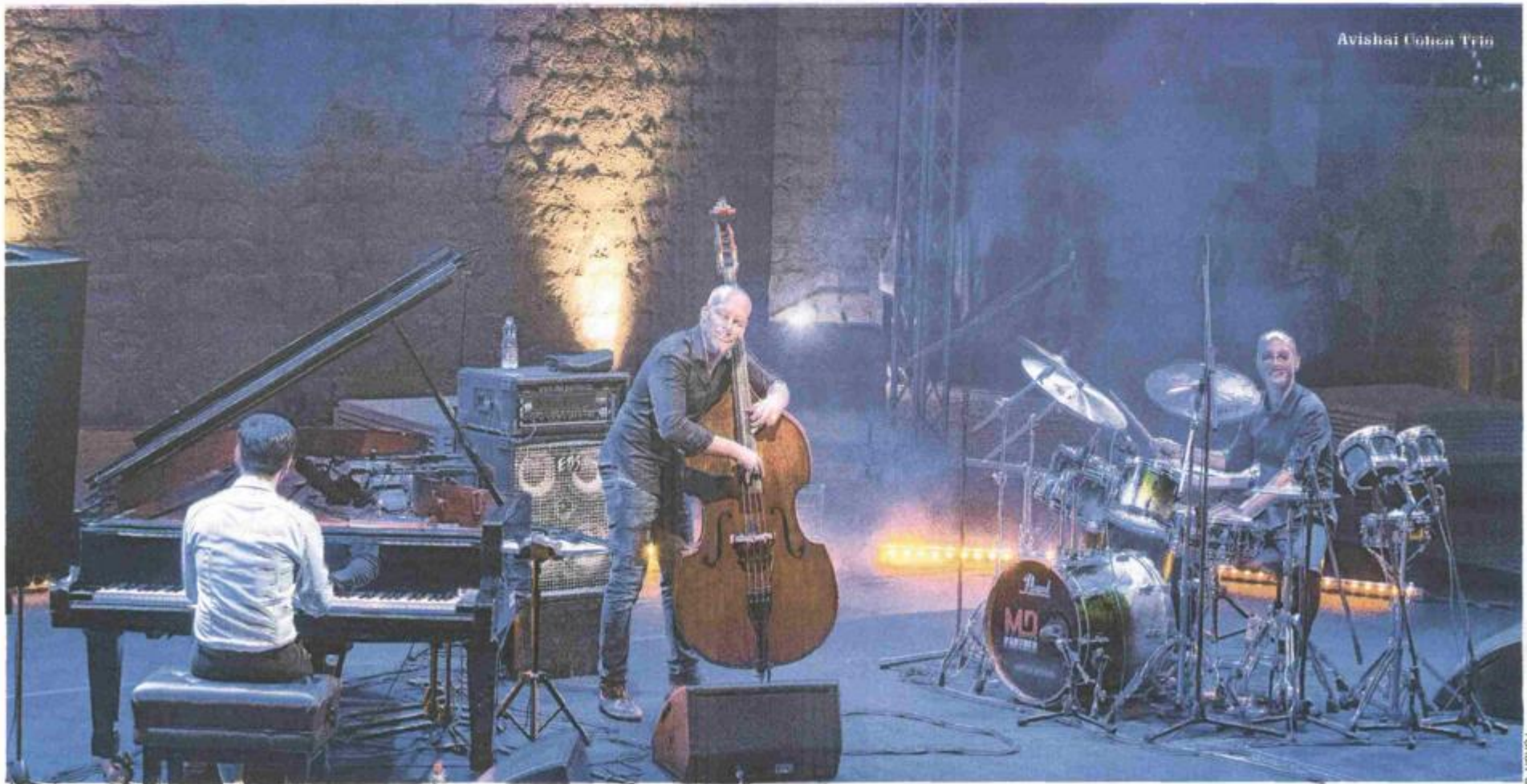
Avishai Cohen Trio

R espektabilan jubilej, 70 godina djelovanja, Dubrovačke su ljetne igre ove godine obilježile tek jednim jazz koncertom, ali kao tijekom svih tih godina, bio je to prvorazredan glazbeni doživljaj. No rijetki su umjetnici čije se djelo može mjeriti s ljepotom Dubrovnik, a jedan od njih je izraelski kontrabasist i skladatelj Avishai Cohen koji je 23. srpnja hipnotizirao mnogobrojnu publiku na taraci tvrđave Revelin. Zapravo, takva konstatacija tek djelomično održava to što se dogodilo te večeri. Naime, malotko u publici bio je spreman u tako kratkom vremenskom razdoblju pohvatati sve detalje koji su se nudili iz trenutka u trenutak, sve te filigranske detalje iz kojih je postupno nastajalo fascinirajuće umjetničko djelo, promjene i iznenađenja kojima su umjetnici testirali spremnost onih kojima su se obraćali da isključivo svojoj racio i prepuste se vođenoj psihoglaboterapiji. Doista, Cohenova glazba ima iscjeliteljsku moć, ali samo ako u potpunosti otvorite svoje kanale i dozvolite mu da zaroni u vaš um, u vašu nutrinu. Oni koju su u stanju prepustiti se, u tim trenucima mogu doživjeti prosvjetljenje, poput jogija koji cijeli život meditira i jednom mu se konačno posreći. Nirvana!