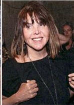
GOŠĆA IZ SRBIJE Glumica Dara Džokić, koju smo donedavno gledali u 'Pogrešnom čovjeku'