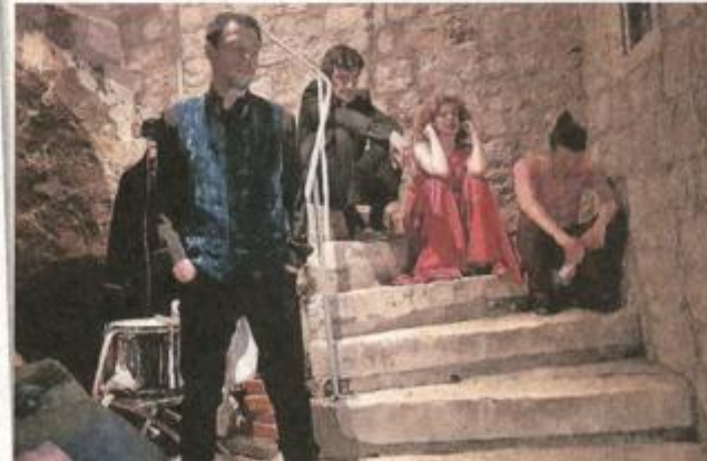
Umor i veselje tijekom 'Hamleta' 'all night long', šekspirijanskog maratona na koji su glumci sami pristali