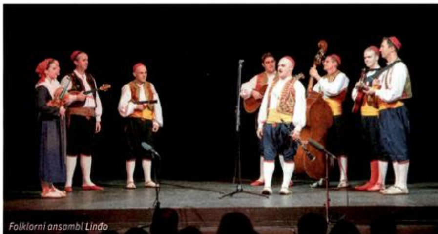
Folklori ansambl Lindo