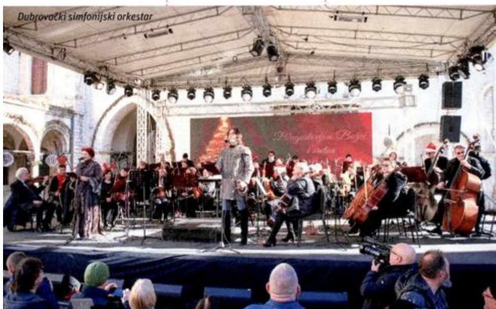
Dubrovački simfonijski orkestar