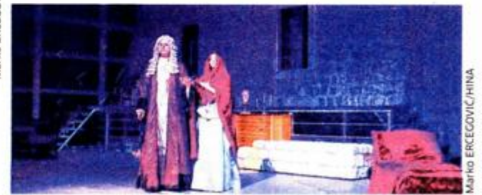
Prikaz povijesti obitelji Gundulić