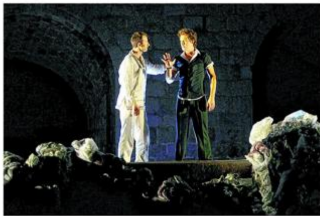
Predstava »Hamlet« koju je režirao Kunčević

- Tek tada sam se zarazio kazalištem, teatrom Igara posebno... – rekao je u razgovoru iz 2019. godine.