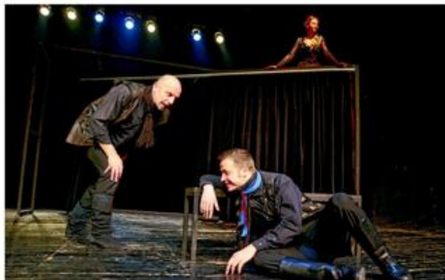
Značajno je i uprizorenje »Cyrana de Bergeraca«