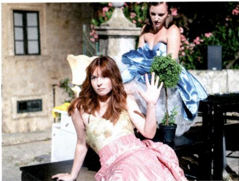
TEKST JOŠ UVIJEK SVLADAVAMO JER ŽELIMO DA SVE BUDE TOČNO, DA BUDEMO PERFEKTNI'

imao jaku dobru vezu s Venecijom i to znanje, kao i umjetnost, dolazili su iz Italije.