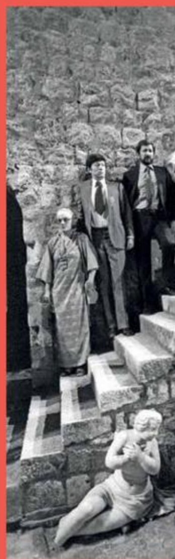
Tonko nikada nije sputavao svoju suprugu u karijeri. Dapače, bio je izuzetno ponosan na sve njezine uspjehe

PROFESIONALNI PUTEVI STALNO SU IM SE ISPREPLITALI, A KOD KUĆE NISU GOVORILI O POSLU