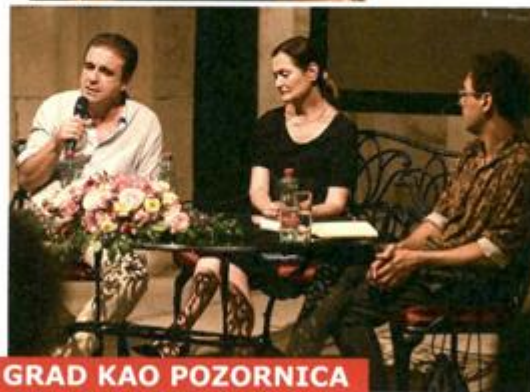
GRAD KAO POZORNICA