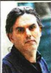
Piše: ILKO ČULIĆ

Dok su njegovi vršnjaci tulumarili uz R&B i hip-hop, Porter je slušao je stare ploče s klasicima gospela, soula i bluesa, a što je usvojio pokazat će publici 15. kolovoza na Taraci tvrđave Revelin u Dubrovniku